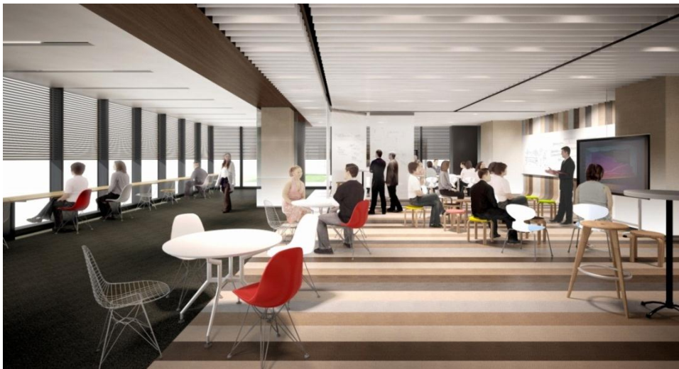
ナレッジサロン「プレゼンラウンジ」イメージパース