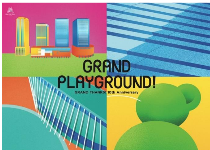
「GRAND PLAYGROUND!」メインビジュアル

まちびらき10周年を迎えるにあたり、そしてこれからの10年間を見据え、この度グランフロント大阪では新ビジョンを策定しました。「創り出そう、ともに。」をスローガンに、これまで以上に多様な人々を巻き込み、進化に挑戦しつづけるまちを目指します。その新ビジョンを来街者の皆さまに体感いただくためのテーマは、「 GRAND PLAYGROUND GRAND PLAYGROUND! 」。まち全体をグランフロント大阪らしい「 GRAND PLAYGROUND グラン(壮大)な「みんなの遊び場」 」にすることで、大人も子どもも自然にまちに集まり、訪れるすべての人がワクワクし、新たな感性と意欲が湧いてくる——「遊ぶ」という主体的な行いを通じて、来街者の皆さまがまちを再発見するきっかけをつくることで、長く愛されつづけるまちを目指します。