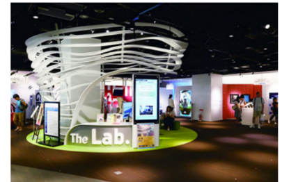
ザ・ラボ 2階展示スペース

企業や研究機関、大学などが出展し、子どもから大人まで訪れた誰もがナレッジキャピタルに集う先端技術に触れられる施設です。たくさんの人が見て、触れて、感じたことを取り入れて世界一につながる新しい発見を目指しています。現在、展示エリアとなるアクティブラボには、5つの大学と2つの行政・研究機関、6社の民間企業が参画しています。