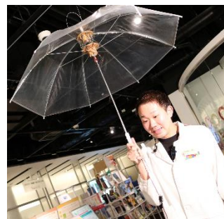
傘の柄を通して振動が伝わる