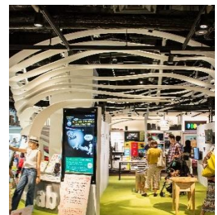
The Lab. みんなで世界一研究所

「アソブレラ」は「The Lab.みんなで世界一研究所」の参画者である「VisLab OSAKA」が、ナレッジキャピタル開業時より展示している「遠隔降雨感覚共有装置」です。