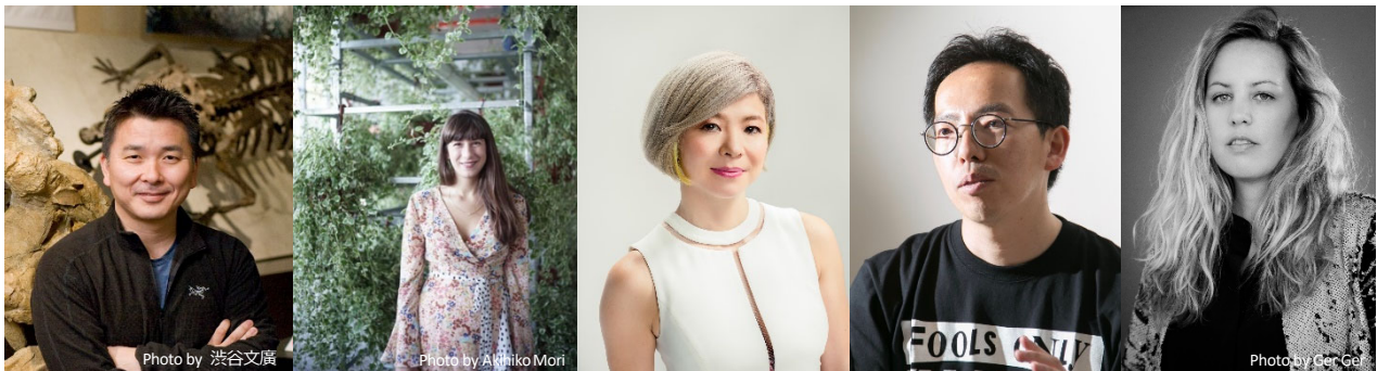
World OMOSIROI Award 6th. 受賞者