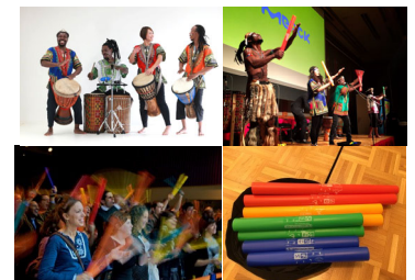
ドラムカフェイメージ

今回は、56カ国、200万人以上が体験している「インタラクティブ・ドラミング」を実施し、受賞者、選考委員、そして一般来場者がそれぞれ楽器を奏でることにより、会場全体が一体となる感覚をご体験いただけます。