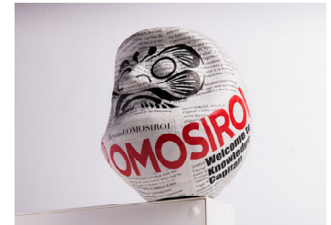
World OMOSIROI Award 6th. トロフィーイメージ

(URL : https://kc-i.jp/activity/award/omosiroi/ )