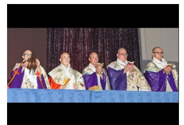
声明ライブイメージ

仏教の聖歌ともいわれる声明を、7名の高野山僧侶によるライブでお届けします。1200年の時を超えて、唱え続けられる仏教声楽「南山進流声明」。今回は、寺院の中に閉じ込められてしまった、心揺さぶる僧侶の歌の「OMOSIROI」に迫ります。聞く者の心を洗う声明ライブを、ご体感ください。