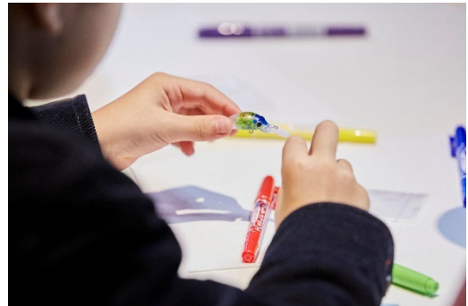
「オリジナルアート作り」イメージ

「ナレッジキャピタル ワークショップフェス」は、開業時より、子どもたちにとってナレッジキャピタルが家庭や学校以外の第三の学びの場となるよう、定期的に開催しています。ウィズコロナで新しい生活様式が広がり、働き方や学びの在り方が変化しているなか、20回目となる今回は、安心して楽しみながら学べる場をご提供できるようオンラインで各コンテンツを配信します。