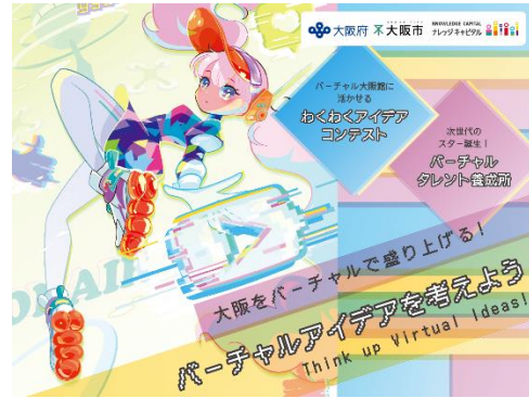
「バーチャルアイデアを考えよう」 メインビジュアル

本協定は、2025年の万博開催に向けた大阪府および大阪市のバーチャル展開について、大阪府・大阪市とナレッジキャピタルが相互に連携・協力すること、また、本プロジェクトを通じて、大阪府民、大阪市民の万博への理解促進および機運の醸成を図ることを目的としています。