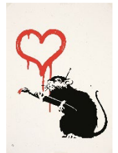
バンクシー 《ラヴ・ラット》 Love Rat 2004年 個人蔵

イタリア・イリー社のダーククロースト豆で抽出したカプチーノに、誰もが知る有名作品をモチーフとした本格ラテアートカプチーノです。バンクシー作品でもっとも登場頻度の高いRAT (ネズミ) はココアパウダーで、ハートは木苺のパウダーで描きます。