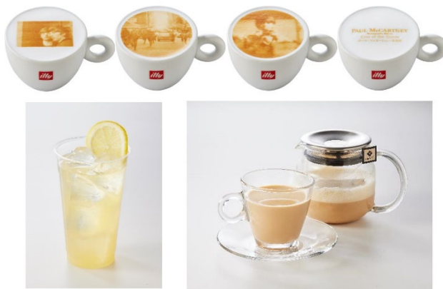
「ポール・マッカートニー写真展 1963-1964～Eyes of the Storm～」コラボメニュー