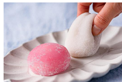
It Wokashi 「It Daifuku」