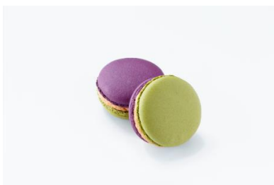
HOSOOU LOUNGE 「かさね色目のマカロン【冬】」

会場では、伝統と現代感覚を融合させた進化系和菓子の販売も行います。西陣織の老舗「細尾」が手掛けるきもの配色美をテーマにしたマカロンや、京都の素材を生かした独自の味の新感覚綿菓子、飲めるほどに柔らかい大福など、斬新な和菓子たちをご堪能ください！