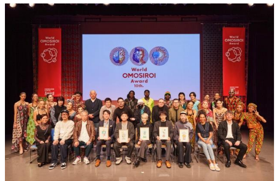
World OMOSIROI Award 10th. の様子

「World OMOSIROI Award」は、ナレッジキャピタルのコアバリューである「OMOSIROI」の価値を世界に発信することを目的として、ナレッジキャピタルと関わりのある国内外の有識者に推薦された人の中から、未来を面白くする「OMOSIROI」を体現する「人」を選出するアワードです。「悦びや好奇心を加速させる創造の原動力であること」などを選考基準に、面白い活動やアイデアを持っている人を表彰します。