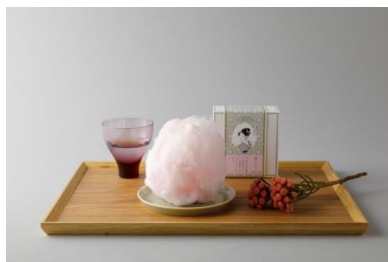
zarame 「京綿菓子-gourmet cotton candy-」