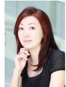
女性に人気の漫画家 桜沢エリカさん