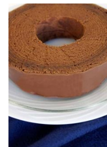
ユーハイムのチョコレート バームクーヘン