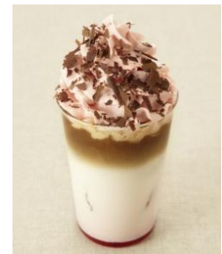
スイートでキュートな バレンタイン限定ドリンク

期間: 2014年2月1日(土)~14日(金) 8:00~23:00(ラストオーダー22:30) 場所: グランフロント大阪北館 ナレッジキャピタル 1階「カフェラボ」 価格: 各 530円(税込み)