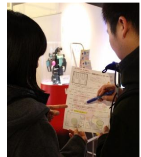
15の展示ブースを体験しながらクイズに答えよう!

期間: 2014年2月1日(土)~14日(金) 10:00~21:00 場所: グランフロント大阪北館 ナレッジキャピタル 2、3階「アクティブラボ」 参加料: 無料