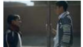
SSFF & ASIA 2015 オフィシャルコンペティション グランプリ作品「キミのモノ」