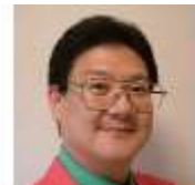
映画評論家 ミルクマン斎藤