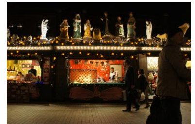
クリスマスマーケットイメージ