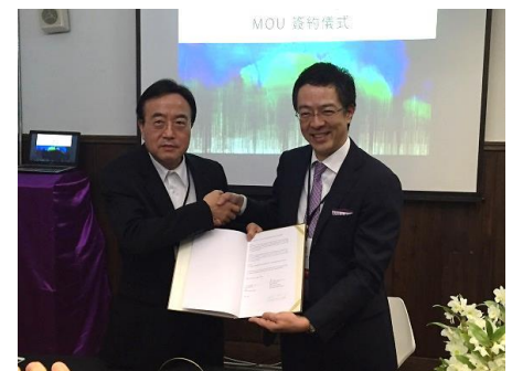
4月に行われたナレッジキャピタルとTDCとのMOU調印式の様子