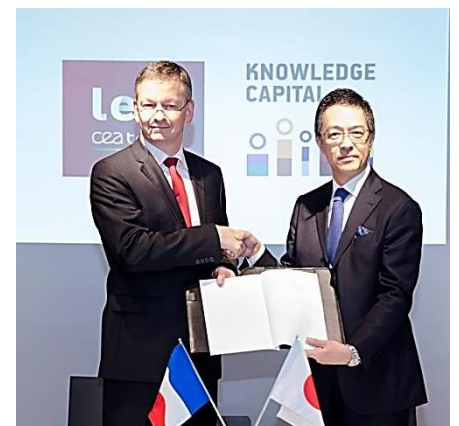
ナレッジキャピタルで行われた調印式の様子

これを契機に、ナレッジキャピタルとCEA LETIの繋がりをより強固なものにしていくことで、相互発展に寄与していきたいと考えております。