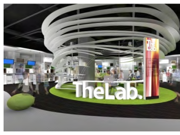
The Lab. みんなで世界一研究所