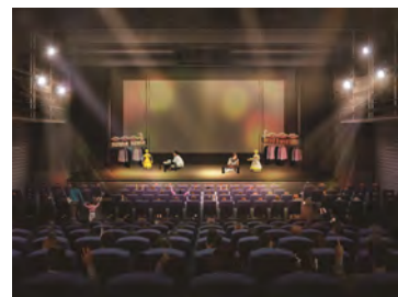
ナレッジシアター