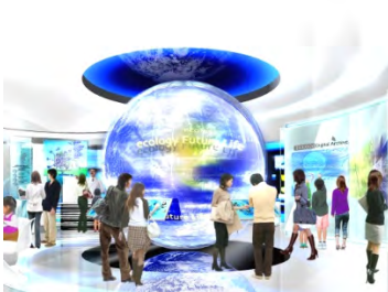
フューチャーライフショールーム