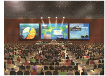
コンベンションセンター