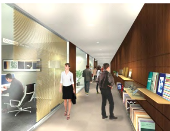
ナレッジオフィス・コラボオフィス