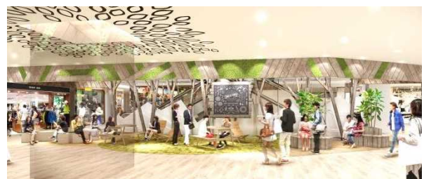
南館5階・レストスペース イメージ