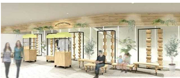
南館4階・レストスペース イメージ

南館4~6階にレストスペースを新設。POP UP SHOP やワークショップを実施できるスペースを併設し、ショッピングの合間にも楽しい時間を提供します。(10月5日オープン予定)