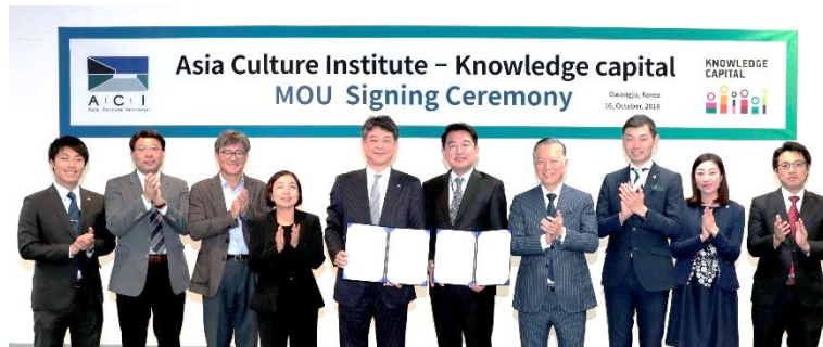
ACIで行われた MOU 調印セレモニー（2018年10月16日）