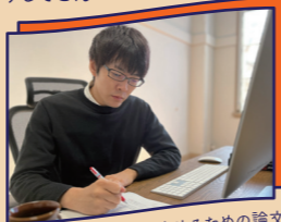
動物言語学を世界に広めるための論文執筆や、シジュウカラ語を使った(!?)絵本の監修も務める

物たちは何を考え、どんなふうに見ているのでしょうか。子どもの頃から現在まで、ずっとその疑問を追い求めてきました。高校の頃に双眼鏡を買ってからバードウォッチングに夢中になり、大学ではシジュウカラの鳴き声の研究を始めました。「どうしてこんなにたくさんの声があるのだろうか？」という単純な疑問から始めた研究でしたが、続けていくうちに鳴き声が単語や文になっていること、翼を使ったジェスチャーがあることなどたくさんの発見がありました。夢中で研究を続けるうちに、いつのまにか大学の先生になっていました。今でも毎年新しい発見があり、充実の日々を過ごしています。好きなことを思いっきり。これが一番だと思います。