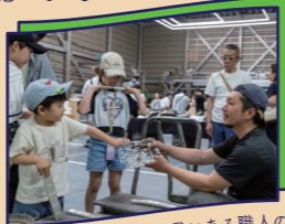
製品の魅力と、その背景にある職人の思いを合わせて伝えるさまざまな体験イベントを開催

どもの頃から、楽しそうに働く父の姿が好きで「能作」の鋳物工場をよく遊んでいましたが、その仕事を継ぐ考えは全くなかったんです。大人になって畑違いの仕事をするなかで、改めて家業の製品(=もの)や職人さんたちが生き生きと働く姿(=こと)、抱えている思い(=ところ)に魅了され、思い切って「能作」に転職。生産管理や受注業務などいろいろなことに挑戦しました。そのなかで、製作体験や錫の器を使ったカフェなど、以前から行っていた工場見学の見せ方をがらりと変えた新しい産業観光のアイデアを企画しました。女性であり、母親である私は、父とは異なる目線で考えることができたのです。目の前のことを多角的な視点で見つめ直すことで、新しいアイデアが浮かんでくるかもしれません。