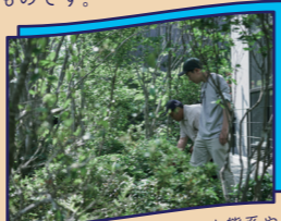
造園ユニット「Veig」として生態系や環境を重視した造園や空間デザインを行う

来の自分を思い描くとき、僕の場合「自分がその時どう感じているだろう」と想像します。気持ちって、特定のものと留まらず、変化し続けます。その変化を「楽しむ」のが重要。悩むことは成長の一部ですから、自分の変化には敏感でありたいものです。将来「何かになる」ことを強く意識する必要はありません。その時々で何に興味を持つかを感じ取り、多様な世界に目を向けてみましょう。異なる領域が交わる場所に、新しい発見や創造が生まれます。趣味と仕事を分けて考える必要もないし、あえて趣味じゃないことを生業にするのも良いでしょう。自分を支える家族や人々も、一生をかけて何かを模索し続けています。せっかくなら一緒に、答えのないこの世界を楽しみたいですね。