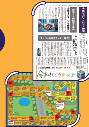
▲ジェントロジーを活かした人生ゲームも作成

「ジェントロジー」とは、年齢を重ねて生じる変化や社会づくりを幅広い分野から研究する学問のこと。研究会のメンバーは、ナレッジイノベーションアワード受賞者らを中心とする中学生たちです。「自分たちの祖父母が社会参画していくためにはどうすればいいか？」「自分たち自身が高齢者となった将来はどうなっているか？」について考え、みんなで社会を盛り上げていくための楽しく前向きなアイデアを提言していきます。