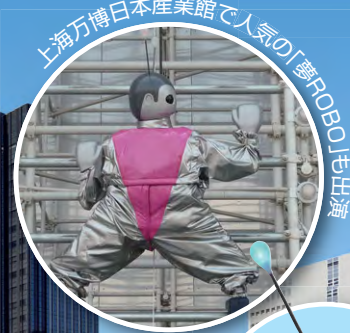
上海万博日本産業館で人気の「夢ROBO」は兵庫