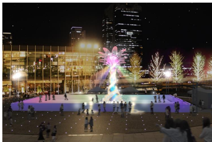
「うめきた広場」イメージ写真