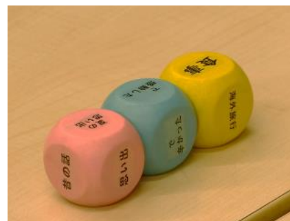
「アイデア理論」のツール